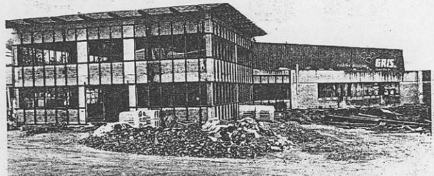
Des travaux d'agrandissement pour partir à la conquête de nouveaux marchés.

Cette entreprise est spécialisée dans la production de rondelles ressort. « Le rapprochement nous permettra de compléter la gamme des produits que nous proposons. On couvrira alors l'ensemble des besoins de la clientèle dans le domaine des accessoires de fixation. »